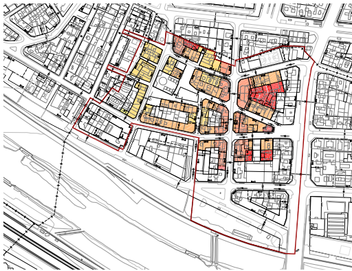
Ordenació proposada clau 12sa