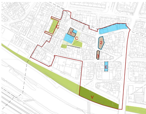
Redistribució de sistemes