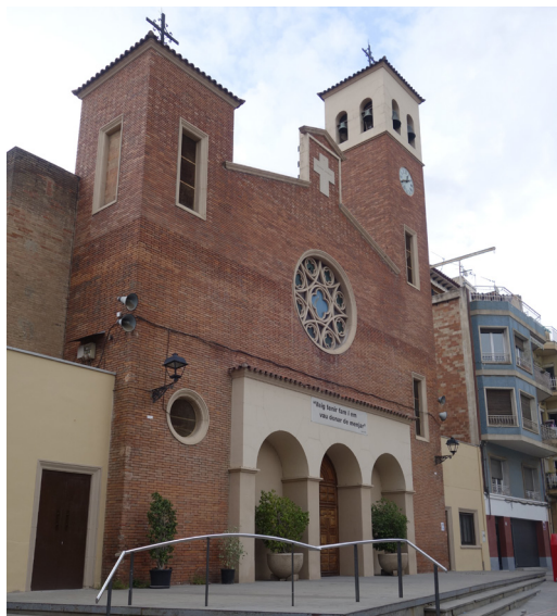
Església Sant Adrià