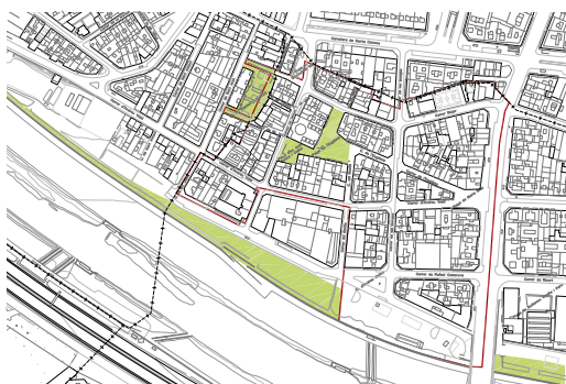
Diagnosi zones verdes