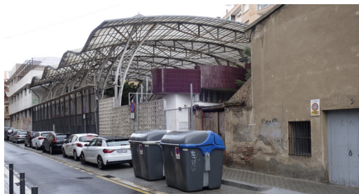
casal gent gran + pista poliesportiva + masia Can Rigalt