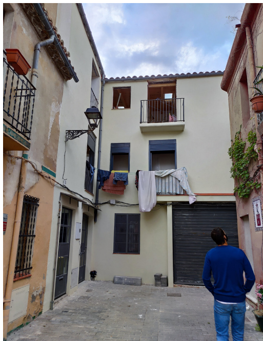
Carrer Sant Bonaventura